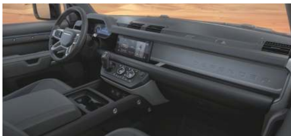
エボニーグレイレザーシートフェイシング（エボニーインテリア）※日本仕様は右ハンドル。