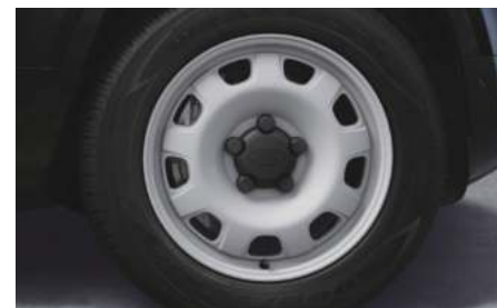
20インチ“スタイル9013”（グロスホワイトフィニッシュ）