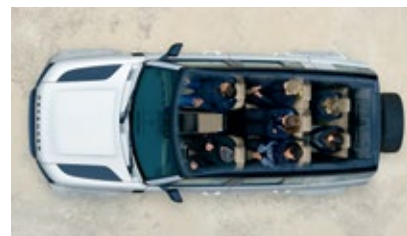
ファミリーパック