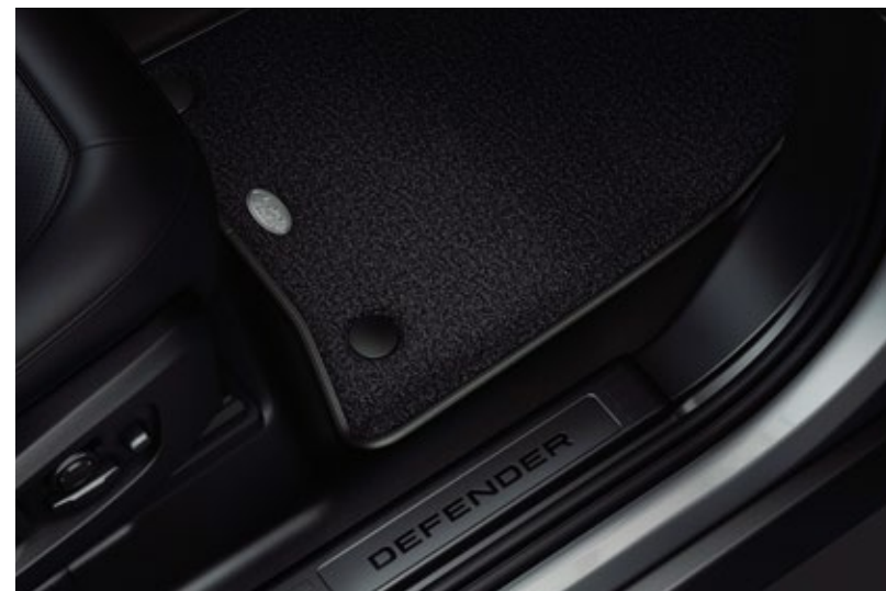
ラグジュアリーカーベットマット