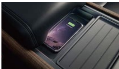
コンフォート&コンビエンスパック