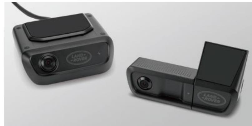
ドライブレコーダーパック