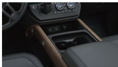
パネル（ラフカットウォールナット）