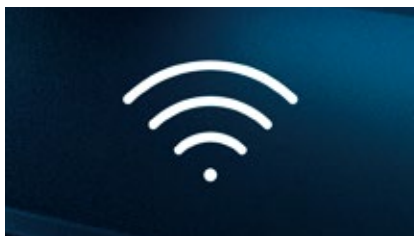
Wi-Fi接続（データプラン付）