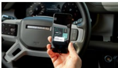
コールドクライメートパック