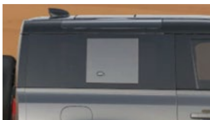
シグネチャーグラフィック（収納スペース付）