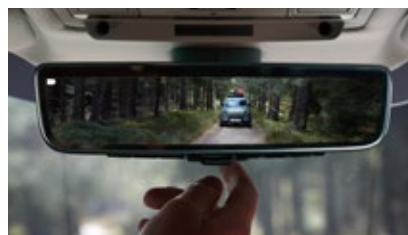
ClearSightインテリアリアビューミラー