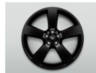
22インチ"スタイル5098"5スポーク （グロスブラックフィニッシュ）