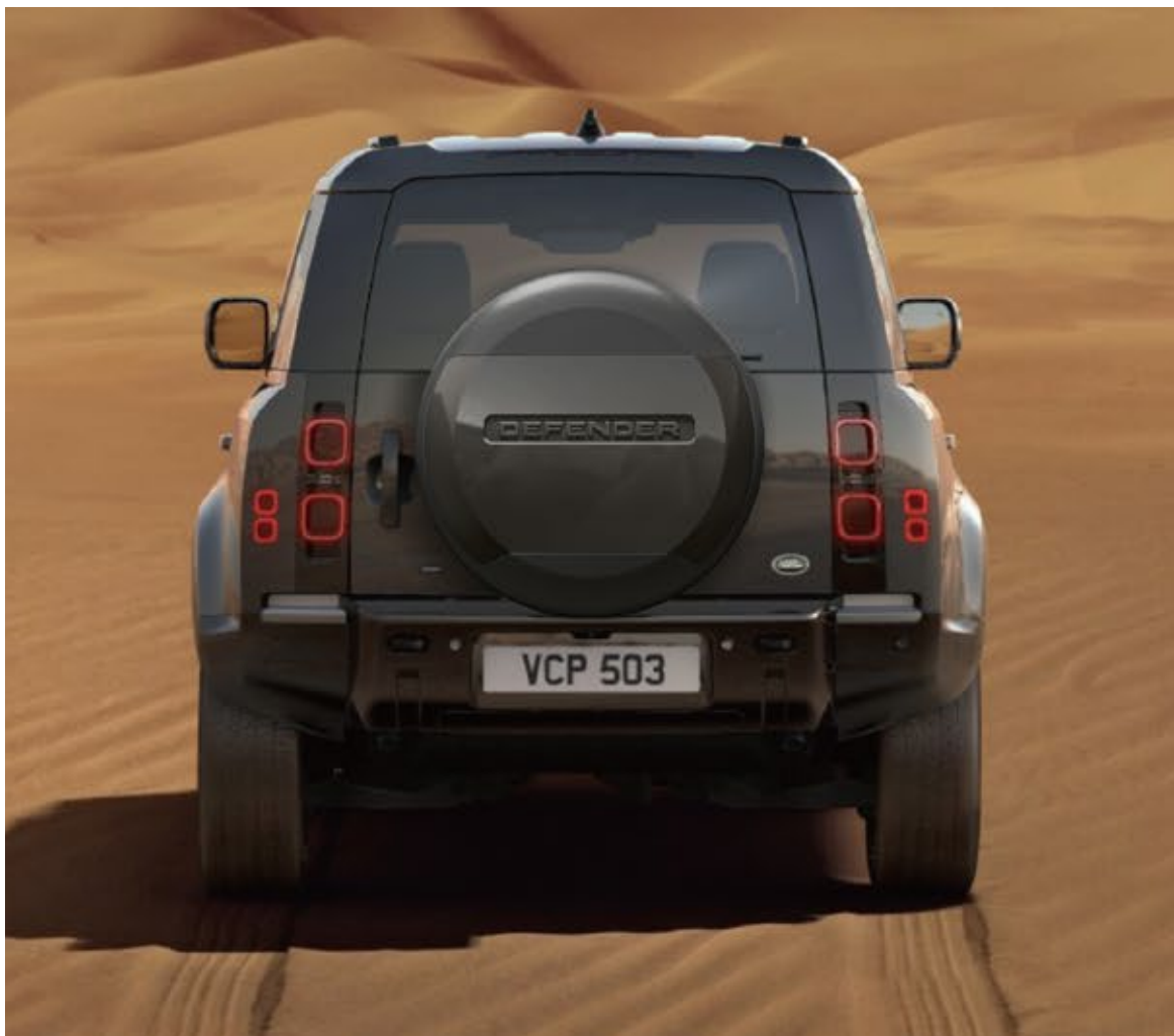
スペアホイールカバー〈ボディカラー〉