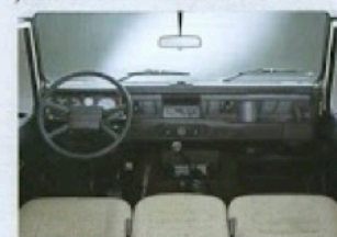
(3-sitzig in Deutschland nicht lieferbar)

Die Bodenfahrfreiheit von 191 mm beim Ninety bzw. von 215 mm beim One Ten läßt den County durch fast jedes Gelände klettern. Dabei über-