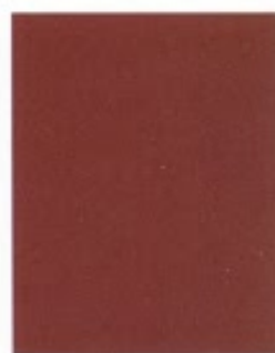
Trocadero Red 467