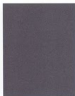
Westminster Grey 445