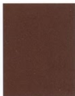
Cairngorm Brown 408