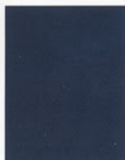
Arles Blue 424