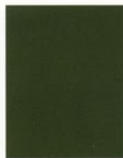
Eastnor Green 419