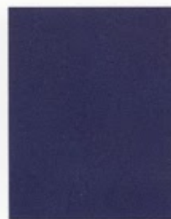
Plymouth Blue 434