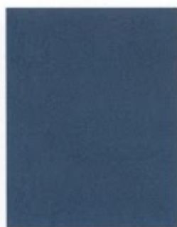
Clearwater Blue 421