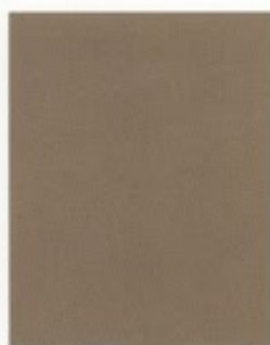
Arran Beige 433